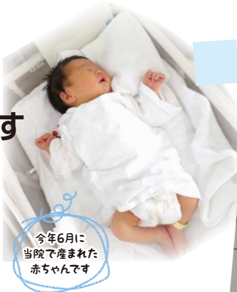
今年6月に当院で産まれた赤ちゃんです